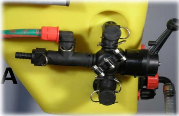
A=80÷100 LT/MIN Durchfluss